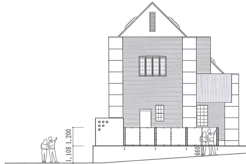
西 立面図 1 : 100