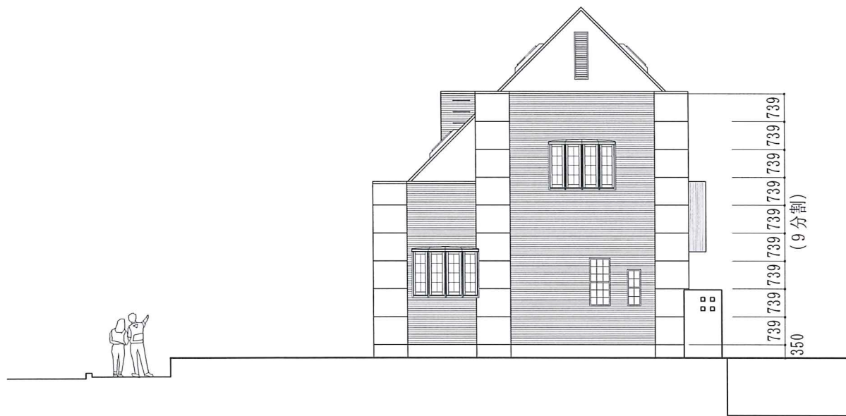
東 立面図 1 : 100