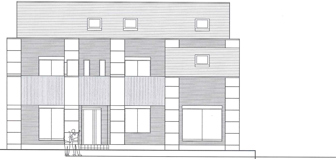
南 立面図 1 : 100